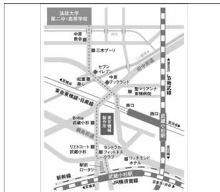
東急東横線「武蔵小杉駅」徒歩10分 JR南武線「武蔵小杉駅」徒歩12分