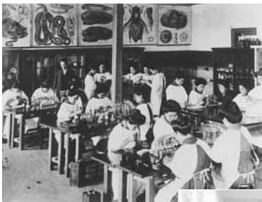
明治期の理科授業

1901(明治34)年に高等女学校として創立以来、女子教育のパイオニアとして、研究・教育プログラムの革新を重ねてまいりました。女子校であることにも、